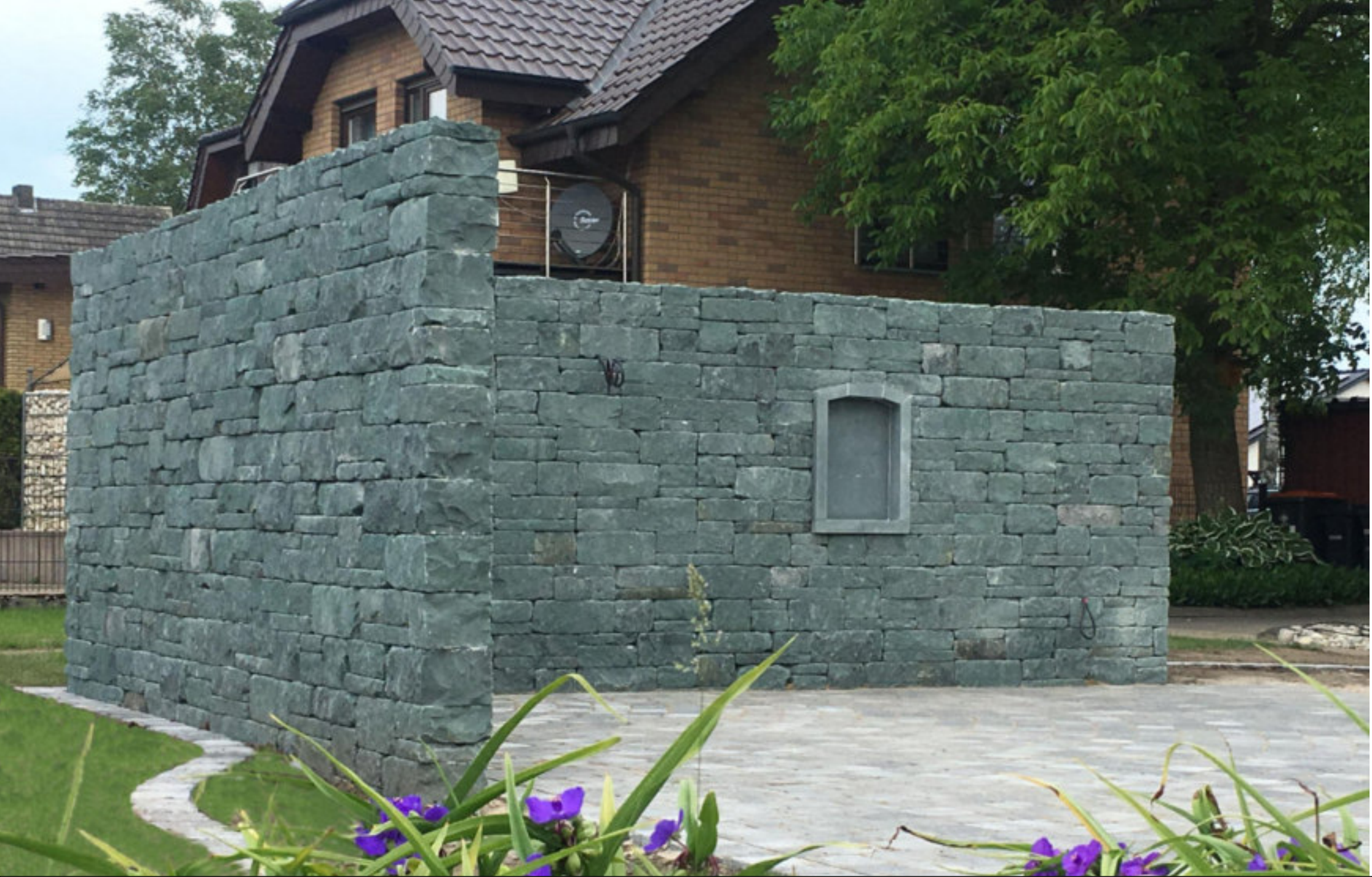
ANTIQUA - SYSTEMMAUER