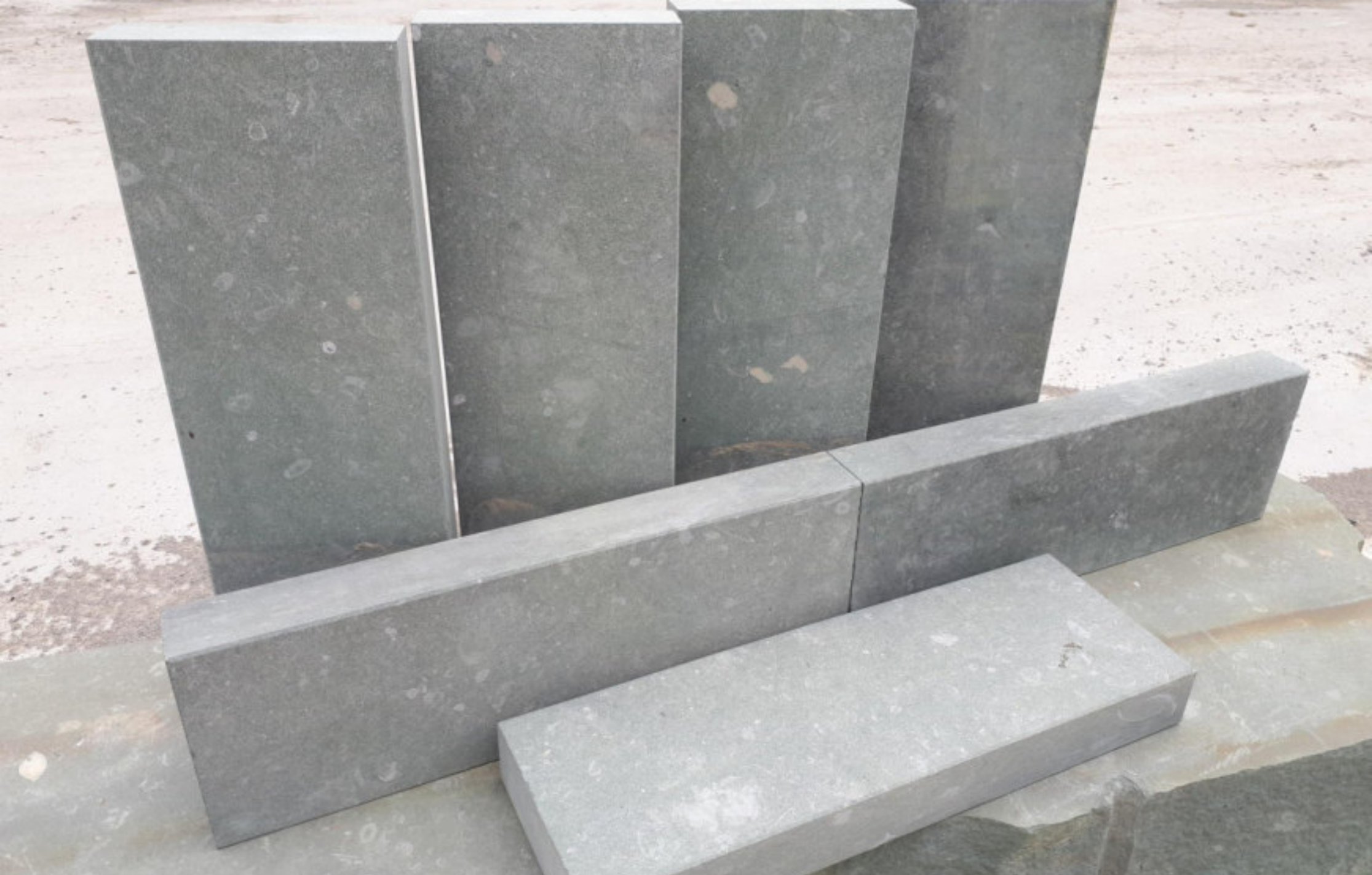
QUADRO - STEIN