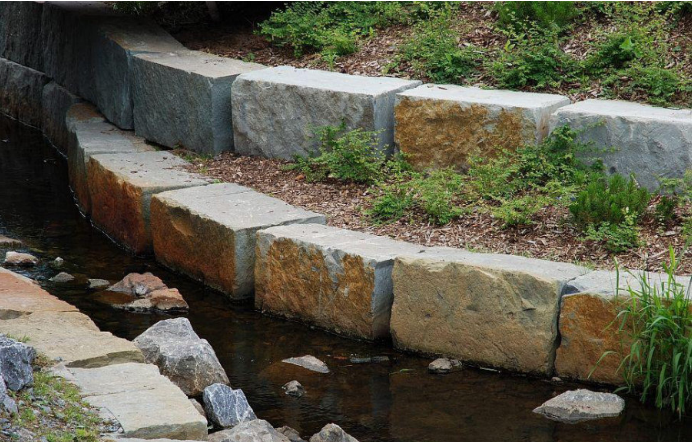
MAUERBLÖCKE / QUADER