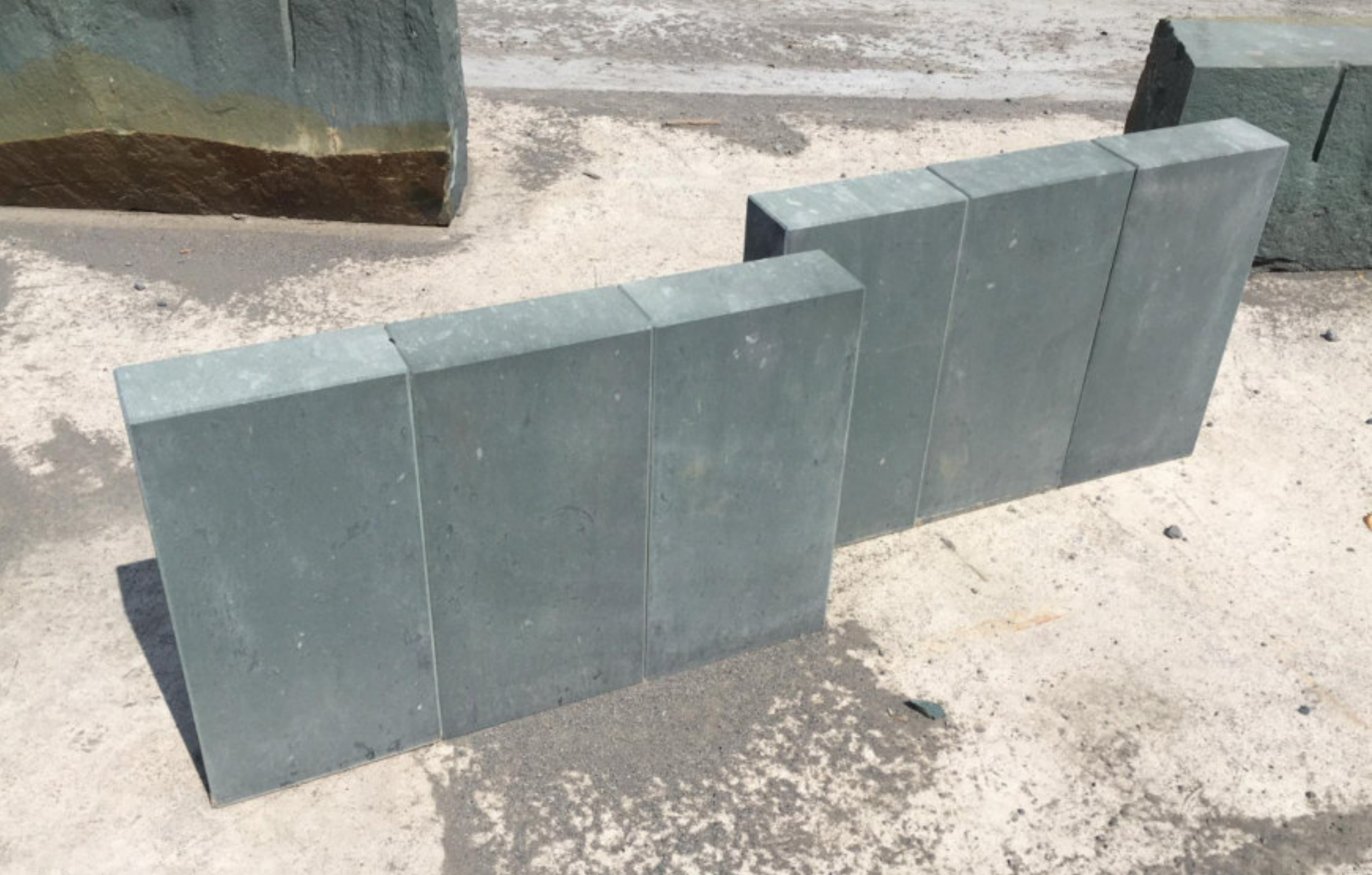
PALISADEN gesägt + gebürstet