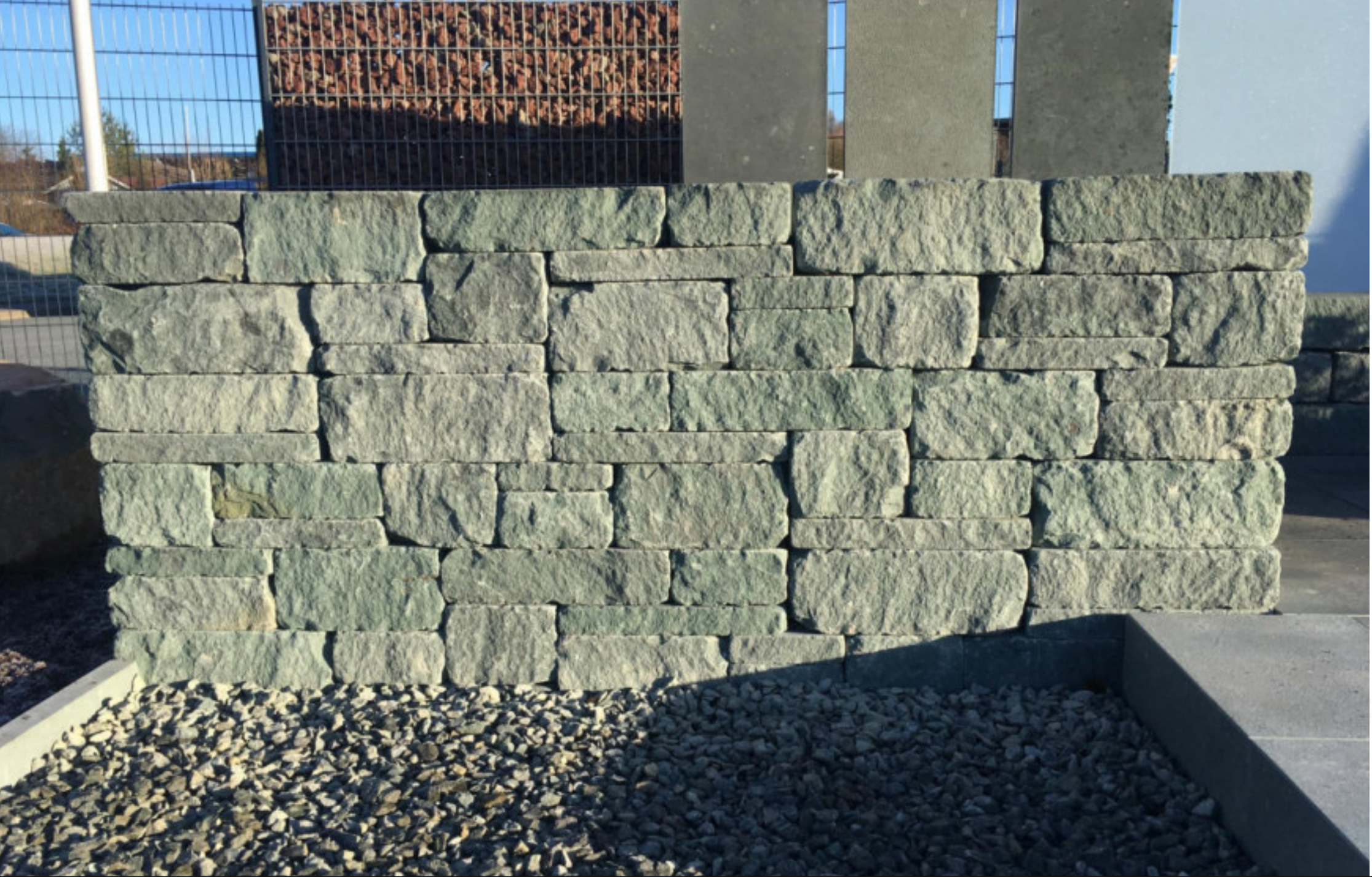
ANTIQUA - SYSTEMMAUER