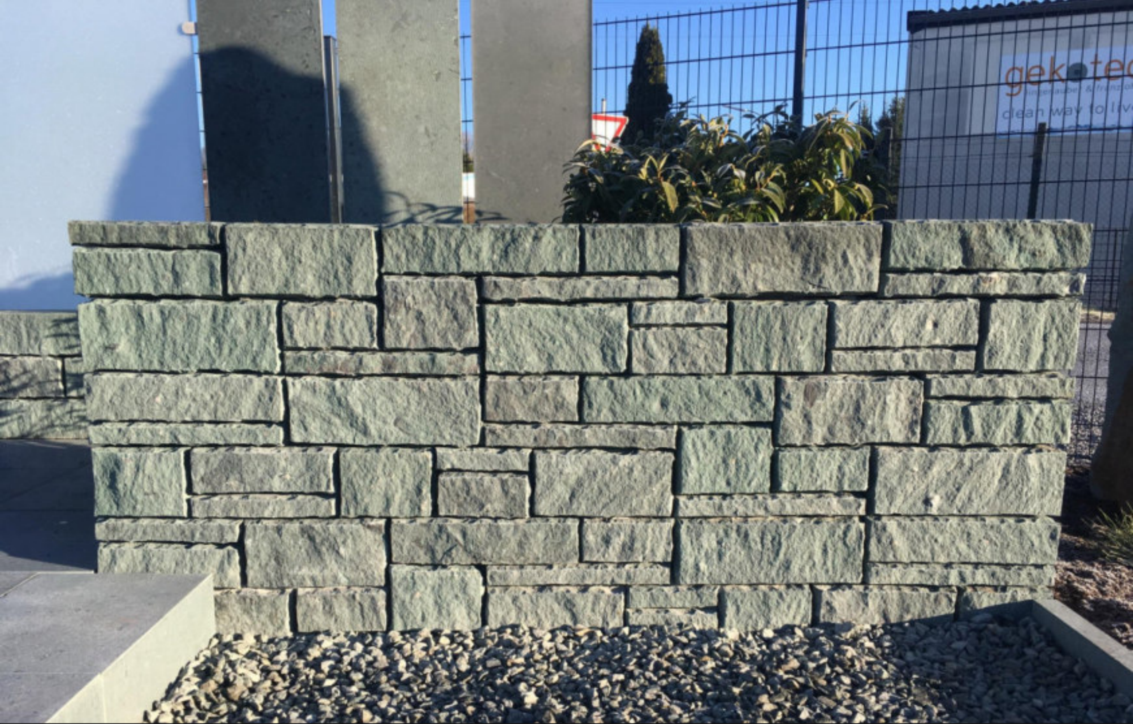
RUSTICA - SYSTEMMAUER