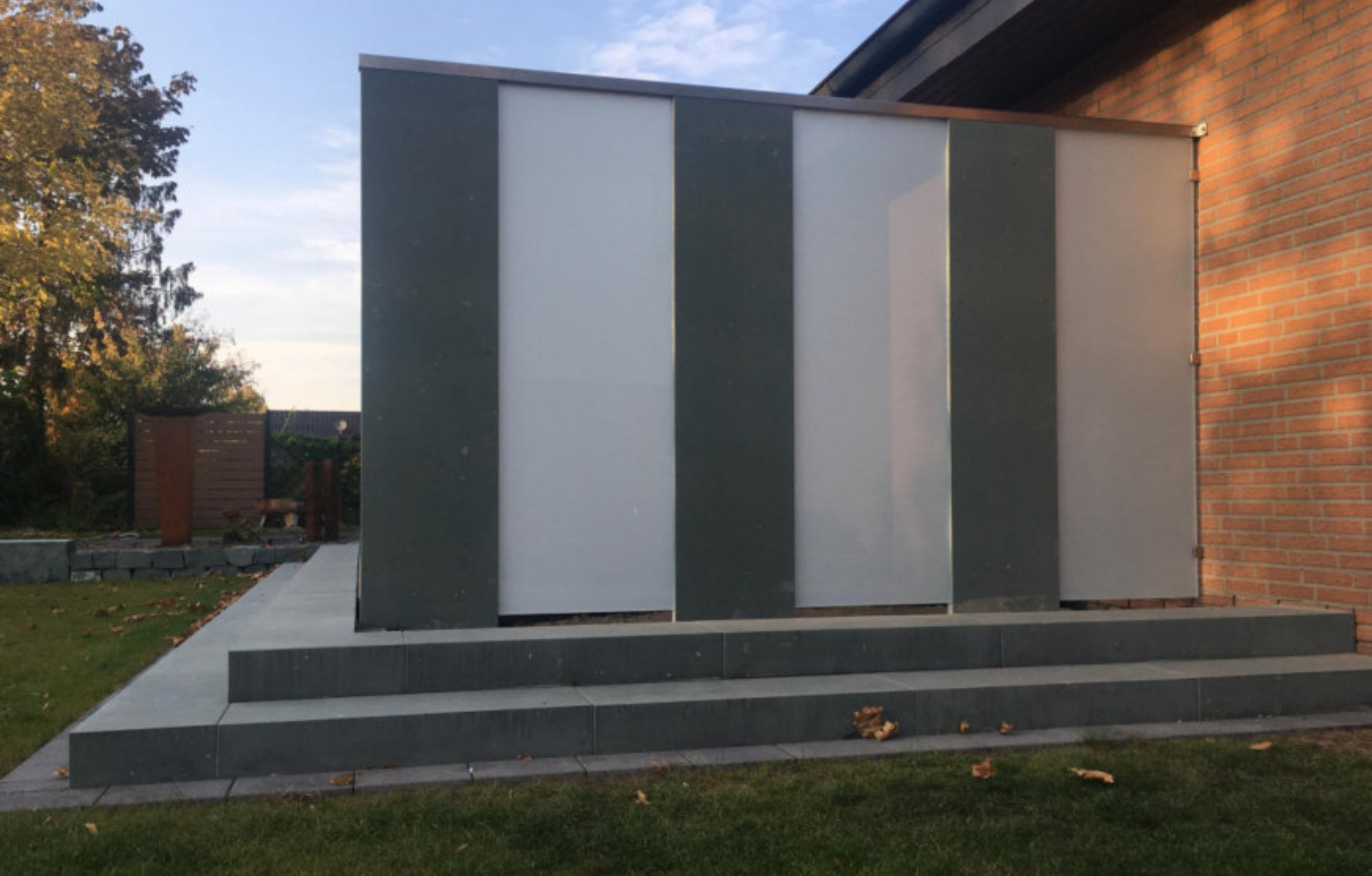
SICHTSCHUTZ - STELEN