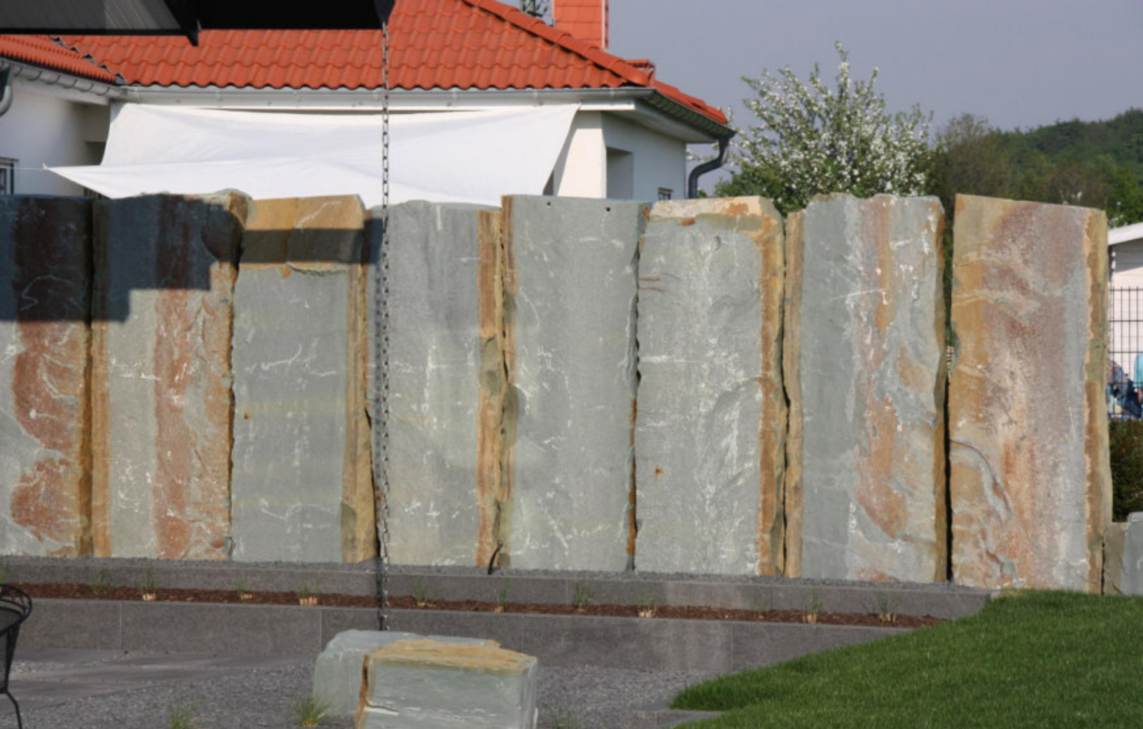
KRUSTENPLATTEN / BLITZKOPFPLATTEN