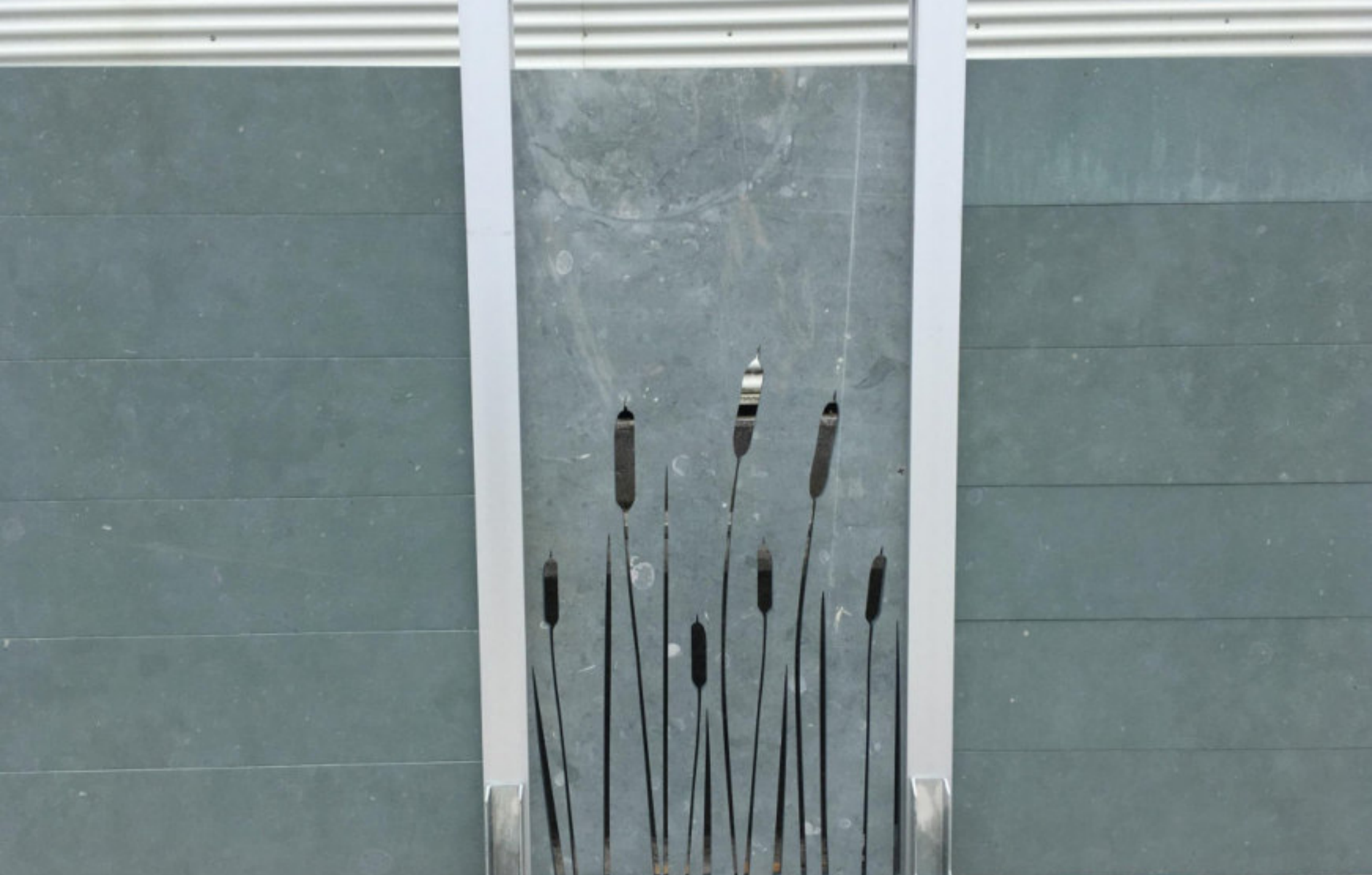
STECKZAUN – DESIGN – ELEMENTE