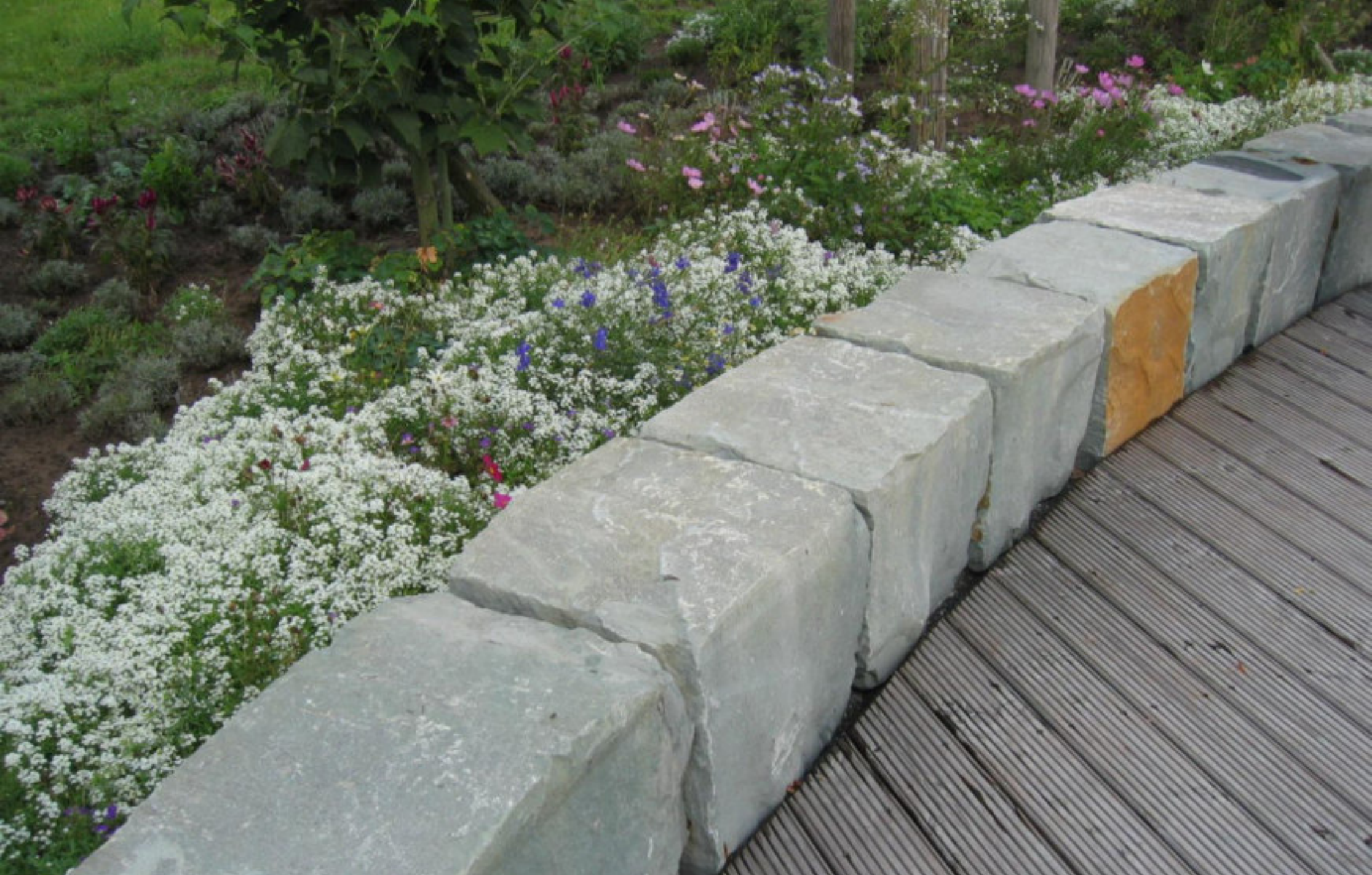
SITZQUADER - gespalten