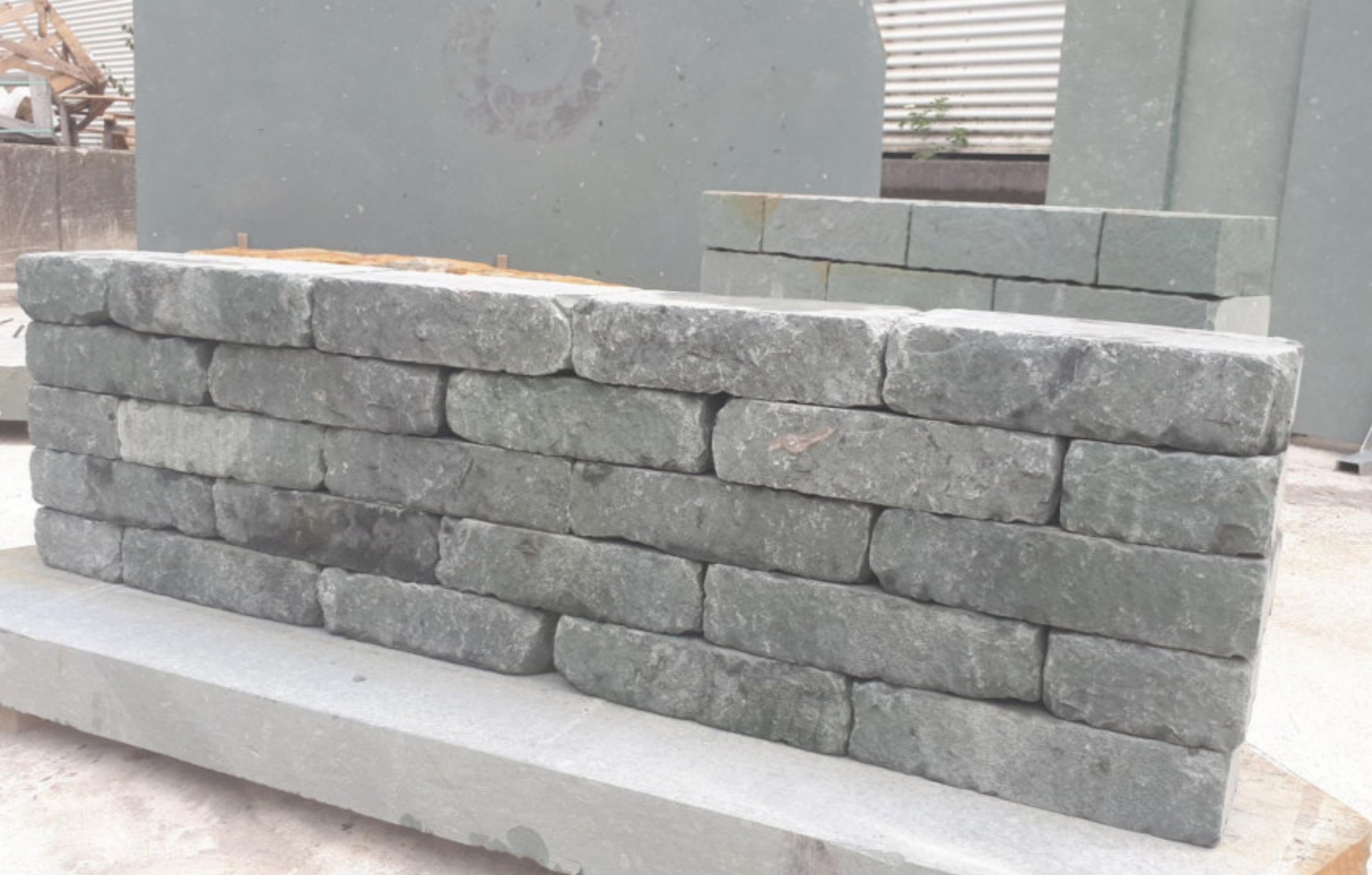
KLIEVER BLOCK antik